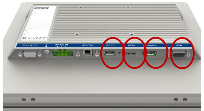
USB 2.0(Type A)/VGA/HDMI/DP